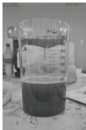
Рис. 4. Кавитационно обработанное масло