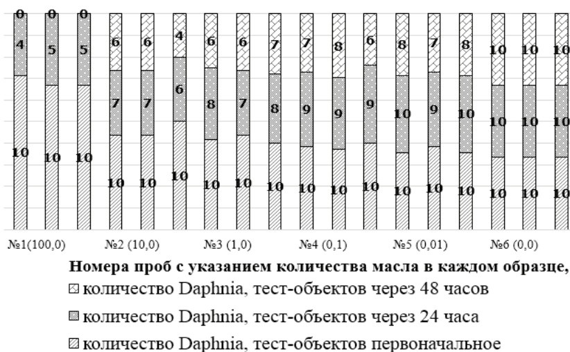
Рис. 2. Фиксация гибели Daphnia в опытных и контрольном образцах

Обе серии экспериментов показали, что ближайшие 50%-е скачки, как в смертности биокультуры Daphnia , так и в снижении величины оптической плотности водоросли Chlorella pyrenoidosa , наблюдались между пробами 1 и 2.