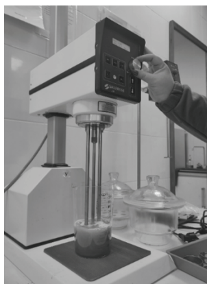
Рис. 3. Суперкавитационный миксер Silverson L5

Сжигание ВМЭ уменьшает сажеобразование, вызванное, как правило, дефицитом кислорода в зоне реакции [8]. Очевидно, что водяные пары, имеющиеся в достатке в ВМЭ, гарантируют сгорание углерода с образованием СО и затем доокисляются до СО 2 , то есть более высокая эффек-