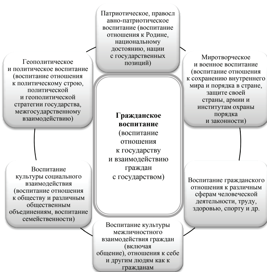
Рис. 2. Интеграция гражданского воспитания и других направлений воспитания