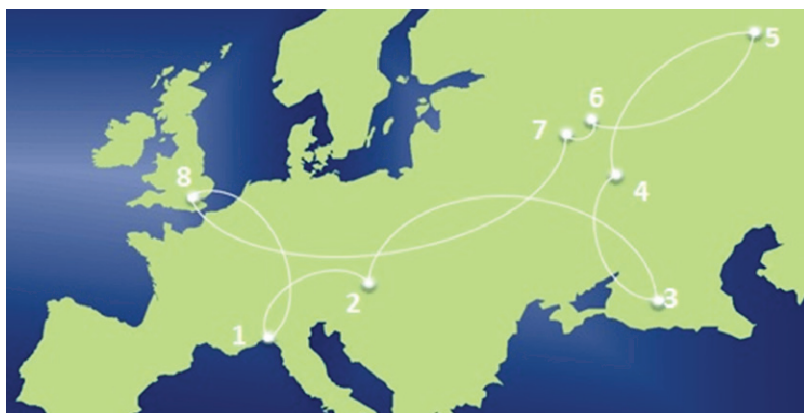
Рис. 2. Сеть университетов проекта Netwater [19]:

1 – Университет г. Генуи, Италия; 2 – Словацкий университет технологий в Братиславе (СУТЬ), Словакия; 3 – Ставропольский государственный аграрный университет (СГАУ), Россия; 4 – Тамбовский государственный технический университет (ТГТУ), Россия; 5 – Уральский федеральный университет имени первого Президента Б. Н. Ельцина (УрФУ), Россия; 6 – Владимирский государственный университет им. А. Г. и Н. Г. Столетовых (ВлГУ), Россия; 7 – Московский государственный технический университет им. Н. Э. Баумана (МГТУ им. Н. Э. Баумана), Россия; 8 – Университет Мидлсекс, Великобритания