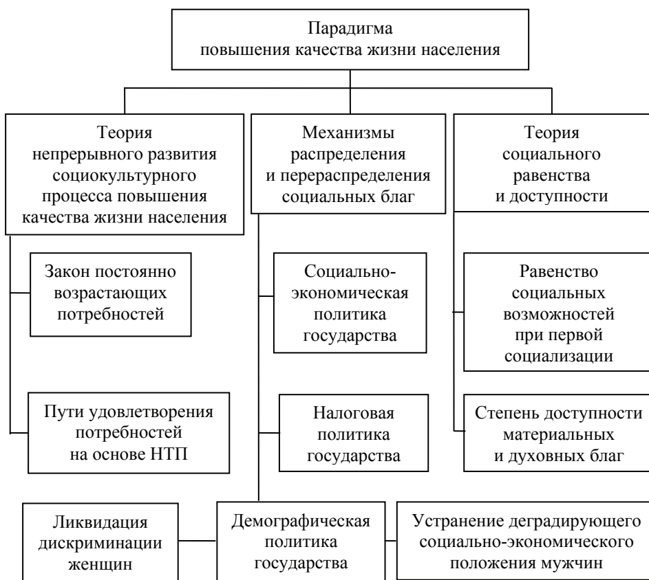
Рис. 2. Система базовых теорий и механизмы парадигмы повышения качества жизни населения

Теория непрерывного возрастания потребностей основана на социально-экономическом законе постоянного возвышения потребностей, а теория удовлетворения потребностей общества базируется на двух подходах: удовлетворение потребностей можно проводить за счет постоянного обеспечения роста производственных мощностей и производства товаров, а также за счет высоких цен. При этом для создания в обществе нормальных условий жизни необходимо устранить дискриминацию женщин и деградирующие социально-экономические условия жизни мужчин (прежде всего, занятость и достойный доход). Теория социального равенства и доступности обосновывает равные возможности молодых людей в период первой социализации (детство, юность, получение профессии и т.д.) и доступности к культурным ценностям.