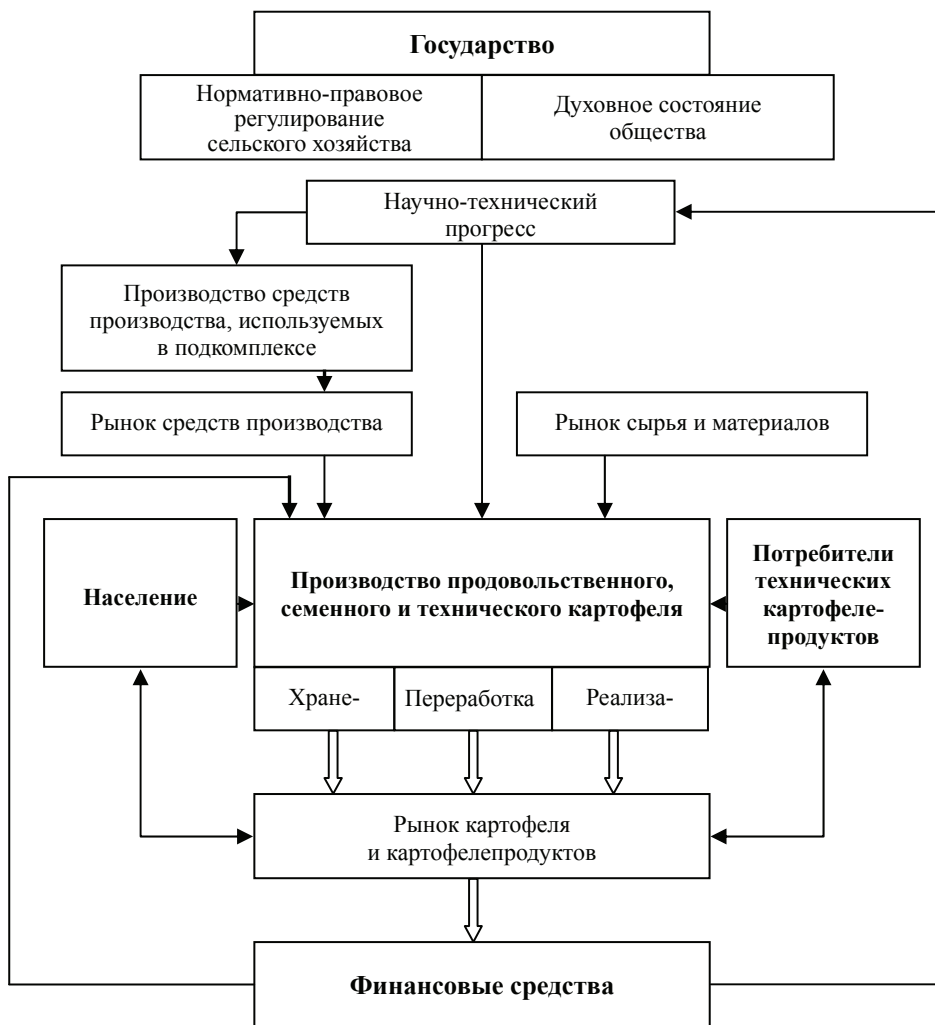
Рис. 1. Модель функционирования картофелепродуктового подкомплекса

продукции, и будет способствовать повышению эффективности производства, защите общих интересов, реализации инновационных проектов и целевых программ развития территорий.