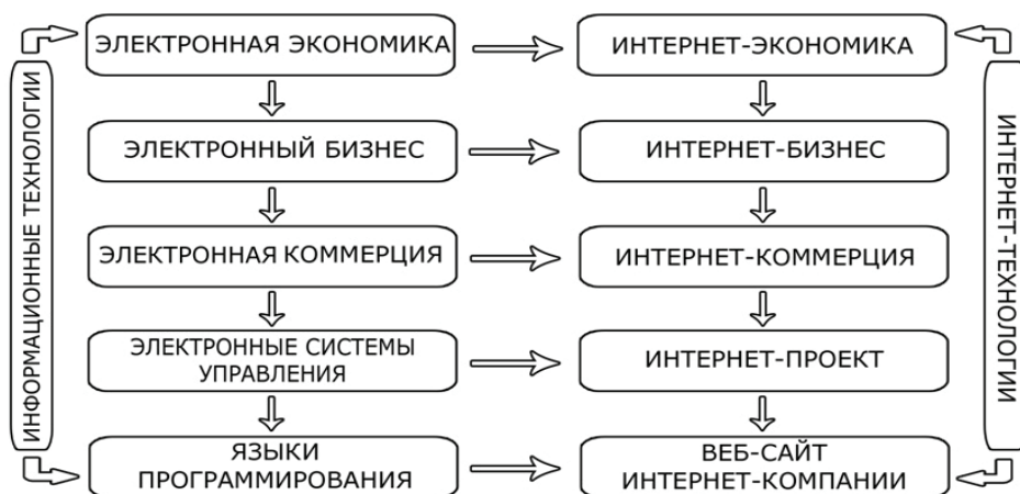
Рис. 1. Структурная взаимосвязь основных процессов, протекающих в информационно-инновационной экономике и определяющих место интернет-экономики

Интернет-бизнес представляет собой одну из форм эволюционного развития электронного бизнеса, являющегося, в свою очередь, подсистемой электронной экономики, базирующейся на информационных технологиях. Интернет-коммерция – это отдельное направление коммерции электронной, выделившееся из нее самостоятельным элементом в начале 1990-х годов XX века. Электронная коммерция построена на электронных системах управления информацией, элементом которых является интернет-проект, выступающий одним из звеньев интернет-экономики. Интер-