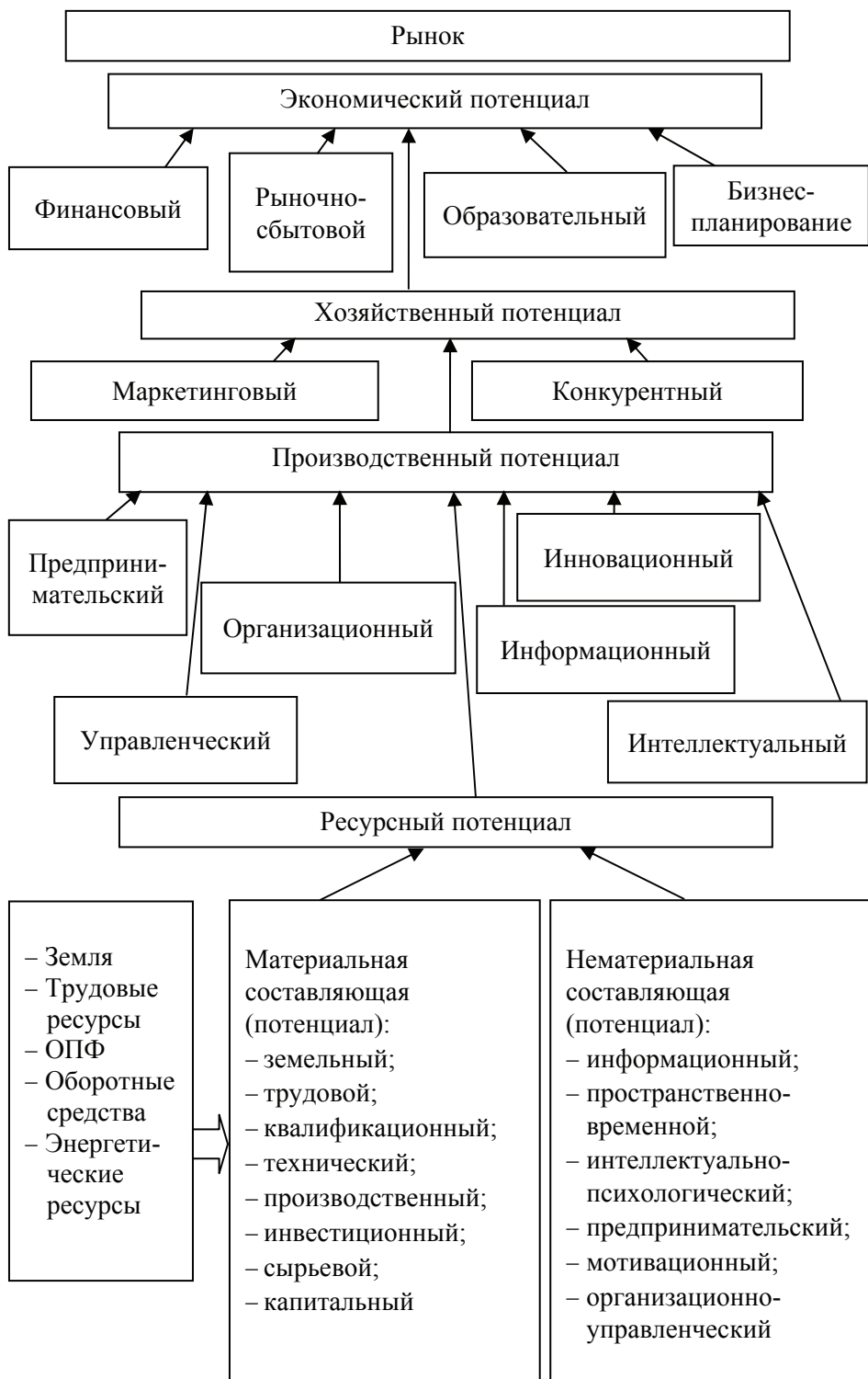
Рис. 3. Взаимодействие ресурсного, производственного и экономического потенциалов