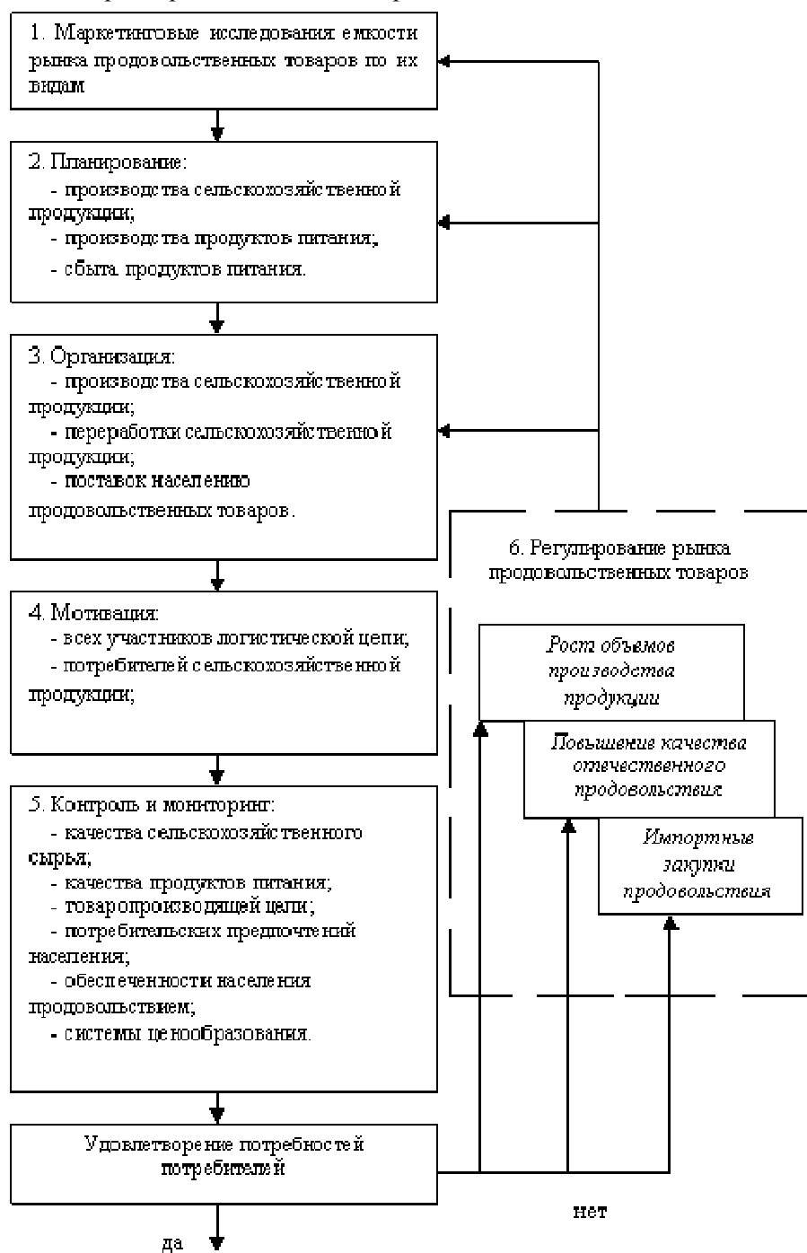
Рис. 2. Организационно-экономический механизм обеспечения населения продуктами питания

При этом должна быть мотивация производства продовольствия у всех участников логистической цепи: поставщик сырья, переработчик, транспортные и сбытовые организации. В этом случае максимально исключаются из процесса посредники, а цена регулируется всеми участниками логистического процесса, что обеспечит участие в ценовой политике производителя сельскохозяйственного сырья и рентабельность его работы.