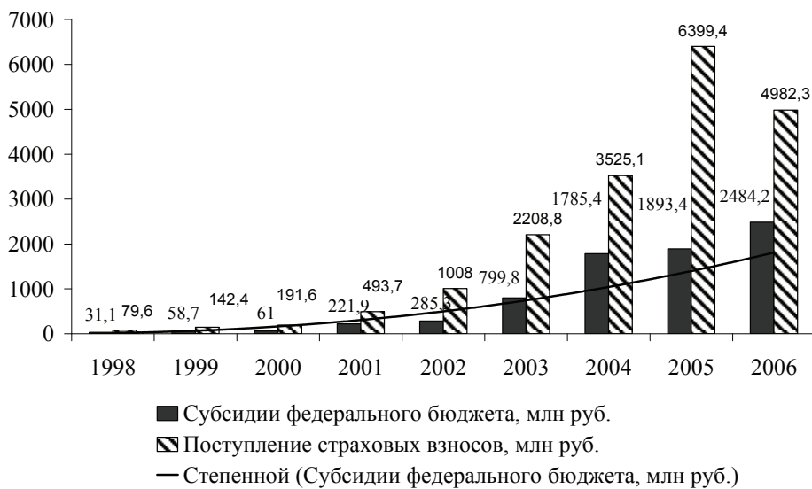
Рис. 1. Субсидии из государственного бюджета на компенсацию сельхозтоваропроизводителям части затрат по страхованию за период 1998–2006 гг. (по материалам Минсельхоза России)

сумму 6399,4 млн руб., однако фактические субсидии федерального бюджета остались на уровне 2004 г. и составили 29,6 % уплаченных страховых платежей, что не соответствует положениям Порядка использования в 2005 году субсидий, предоставляемых из федерального бюджета бюджетам субъектов Российской Федерации для компенсации части затрат сельскохозяйственных товаропроизводителей на страхование урожая сельскохозяйственных культур, где четко обозначено, что компенсации подлежат 50 % уплаченной страховой премии по договору страхования урожая сельскохозяйственных культур.